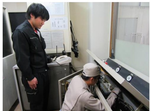
H28.9.15～H28.9.16 機械設備点検（振動検査）