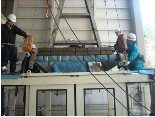
H28.4.12 H28.12.8 搬器切り替え工事