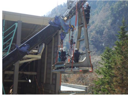
H28.6.20～H28.6.21 索条切り詰め工事（曳索、平衡索）