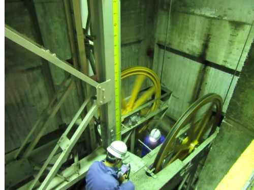
H28.12.6～H28.12.7 油圧ユニット点検