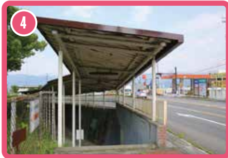
ใช้ทางเดินใต้ดินเพื่อข้ามถนน