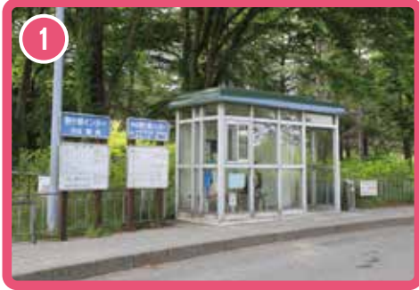
รูปถ่ายป้ายรถบัสทางด่วนที่ทางแยกต่างระดับ Komagane ป้ายรถบัสนี้ใช้สำหรับทั้งขาเข้าและขาออก