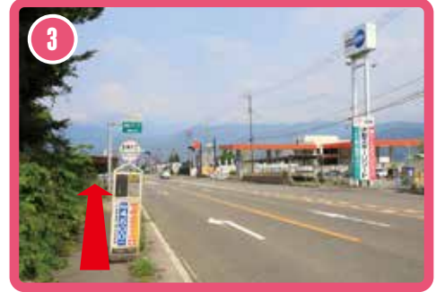
เลี้ยวซ้ายและมุ่งหน้าไปทางทิศตะวันออก (ไปทางทางแยกต่างระดับ Komagane)