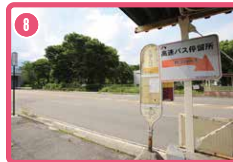
ป้ายรถบัส Nyotai-Iriguchi ตั้งอยู่ที่ทางออกของทางเดินใต้ดิน ขึ้นรถบัสประจำทางจากป้ายนี้เพื่อไปยังกระเช้าลอยฟ้า