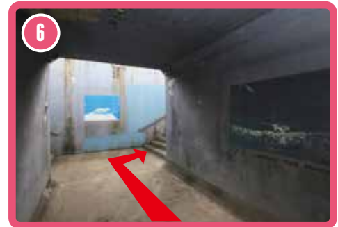
6 เลี้ยวขวาที่สุดทางเดินใต้ดิน