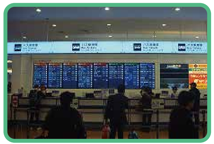
2 ซื้อตั๋วไปสถานี Shinjuku ทางออกทิศตะวันตก