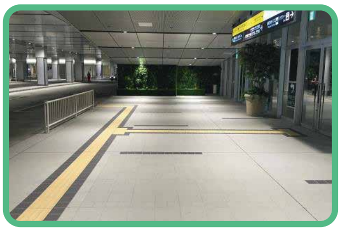
4 ถึงสถานี Shinjuku ทางออกทิศตะวันตก