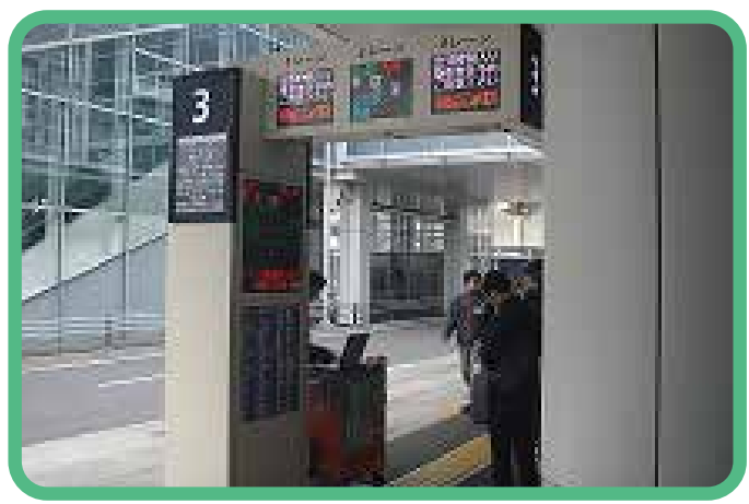
3 นั่งรถบัสสี่ล้อขึ้นจากจุดจอดรถ 3 (ประมาณ 35 นาที)