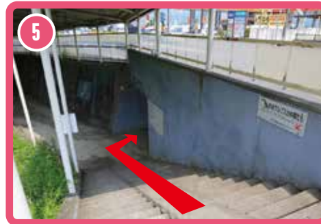
5 เดินลงบันไดและเลี้ยวขวาของทางเดินใต้ดิน