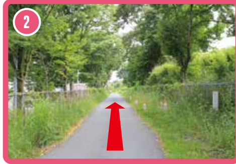
2 เดินไปตามทางเดินทิศตะวันตก ทางนี้จะนำคุณไปยังถนนใหญ่