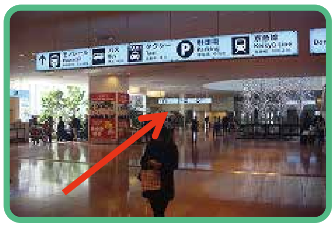
1 เดินเข้าไปยังจุดจอดรถบัสจากลิอบบี้