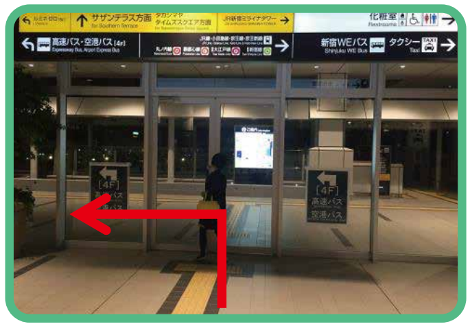
5 ขึ้นบันไดเลื่อนไปยังชั้นสี่