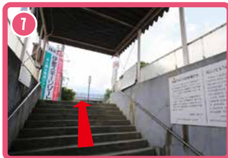
7 เดินขึ้นบันได